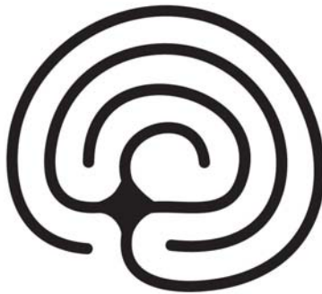
三転型 練習用ラビリンス