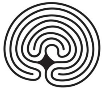
七転型 競技用ラビリンス