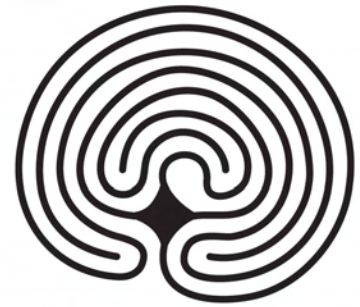
7 Runden Wettbewerbslabyrinth