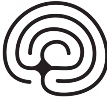
3 Runden Trainingslabyrinth

Neugierig mehr zu erfahren? Schau dir http://www.thelostring.com